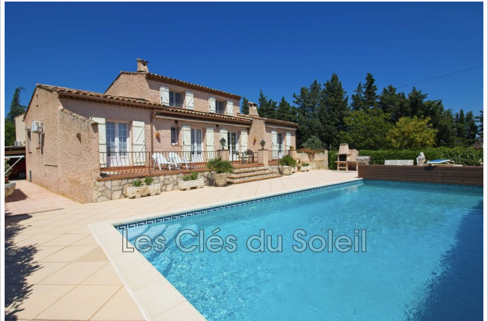
Villa provençale 11462 Cuers

CUERS 83390 - MAISON INDIVIDUELLE DE 147m 2 AVEC PISCINE SUR UN TERRAIN DE PLUS DE 900m 2 . Villa individuelle de 147m 2 sur un terrain de plus de 900m 2 . Sans vis à vis et orientée plein Sud. Les commodités se trouvent à 5min à pied. Belles prestations. Propriété dans un état remarquable. Cuisine équipée, grand salon et salle à manger, 4 chambres dont 2 de plain-pied. Piscine de 12m X 6m au sel. LES PLUS : GRAND GARAGE AVEC PORTAIL ÉLECTRIQUE, ARROSAGE AUTOMATIQUE AVEC FORAGE. DÉPENDANCE. PLUSIEURS PLACES DE STATIONNEMENT. Nous consulter au 04.94.00.12.12